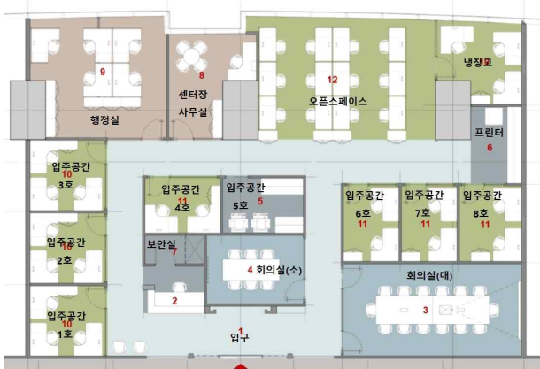
센터 내부 배치도