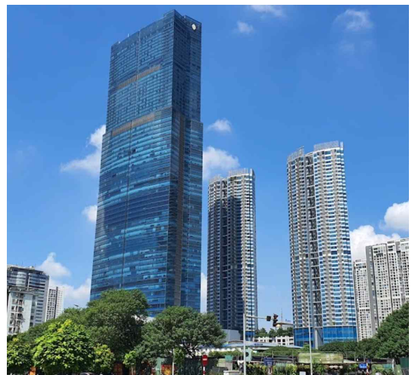
경남 랜드마크72 빌딩 외관